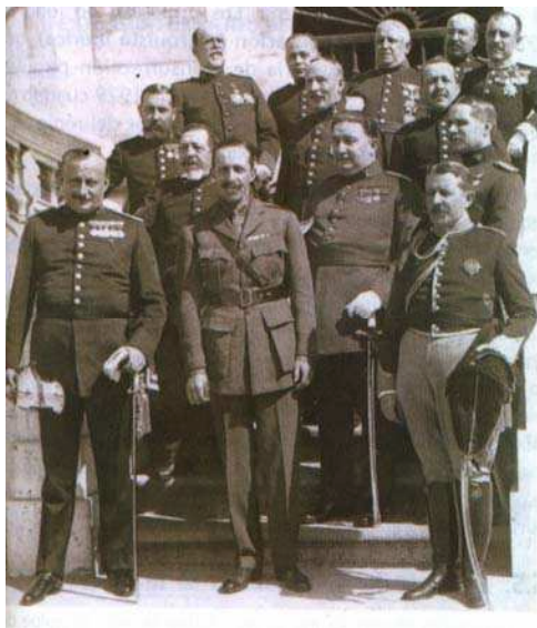
Alfonso XIII y el Directorio militar